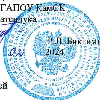
График приема академических задолженностей на отделении ПССЗ с 26 по 29 февраля 2024 года